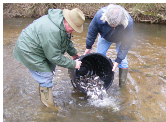
Déversements de poissons par l'AAPPMA de Cosne d'Allier