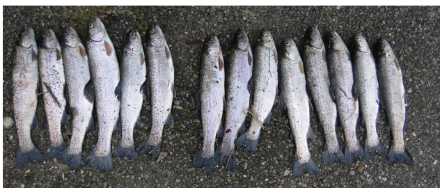
Dépassement de quota de truites

La garderie de la Fédération de Pêche de l'Allier est composée de 4 agents assermentés dont les missions de police pêche ont représenté en 2017, 1/3 de poste soit environ 600 heures. Les gardes fédéraux peuvent être assistés des gardes particuliers bénévoles des AAPPMA et des agents de l'Office National de la Chasse et de la Faune Sauvage.