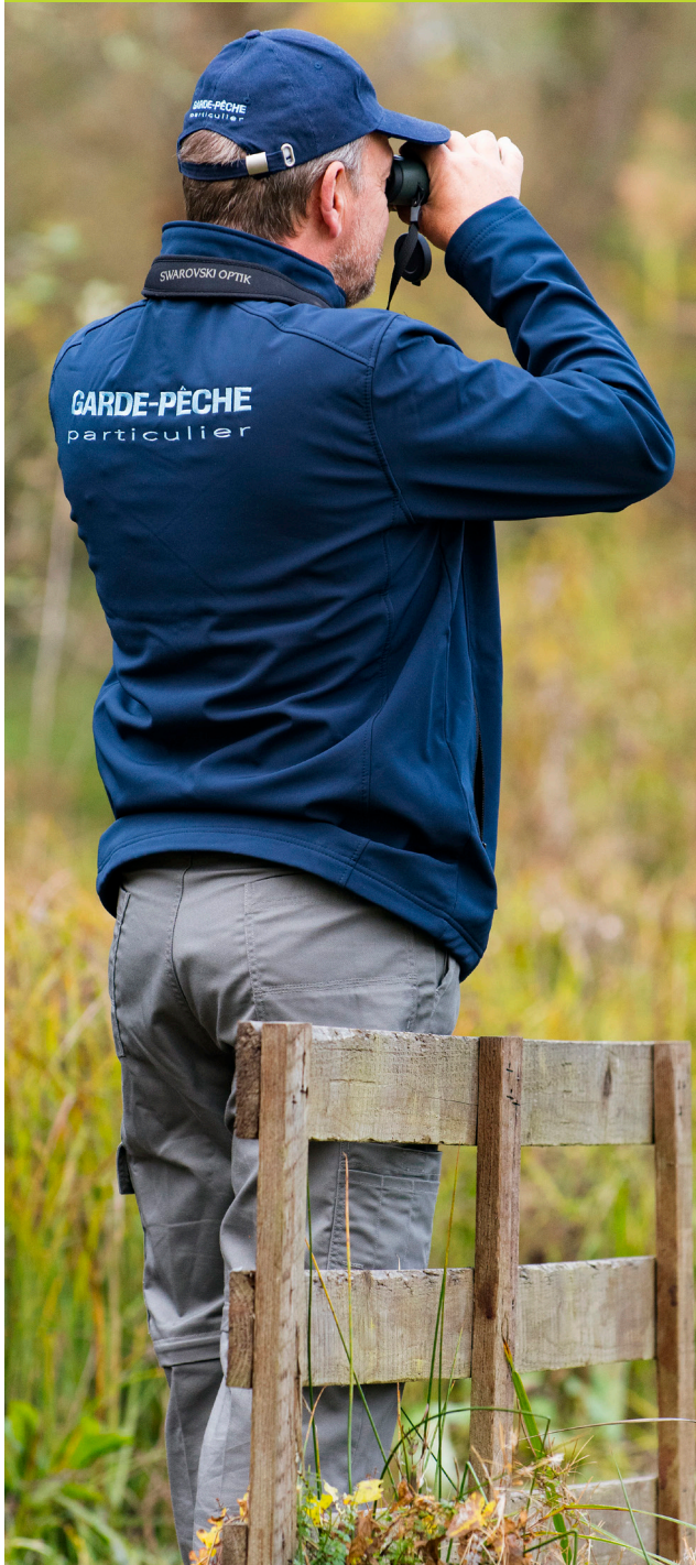
Garde Pêche Particulier

La police de la pêche dans le département de l'Allier est principalement assurée par les agents de développement de la Fédération Départementale. Ces gardes professionnels s'appuient également sur un réseau d'une trentaine de gardes particuliers bénévoles des AAPPMA. Ils exercent des missions de surveillance et de police de la pêche et sont les garants du respect de la réglementation pêche.